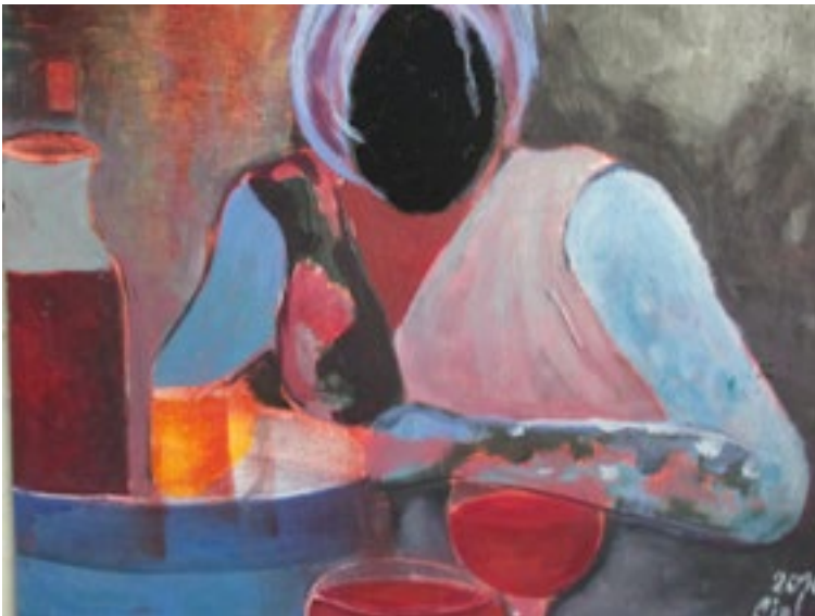
© Ciel Huybrechts, AA-vrouw , 2016