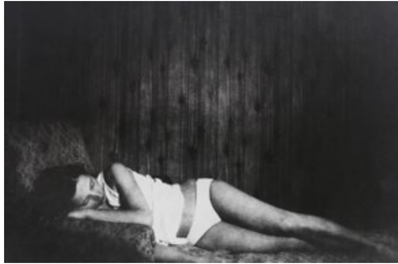
© Els Opsomer, Les dormeuses , fragment, 1991