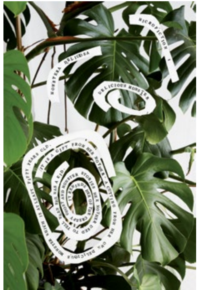
© Ana Torfs, Microfiction 1 , 2019