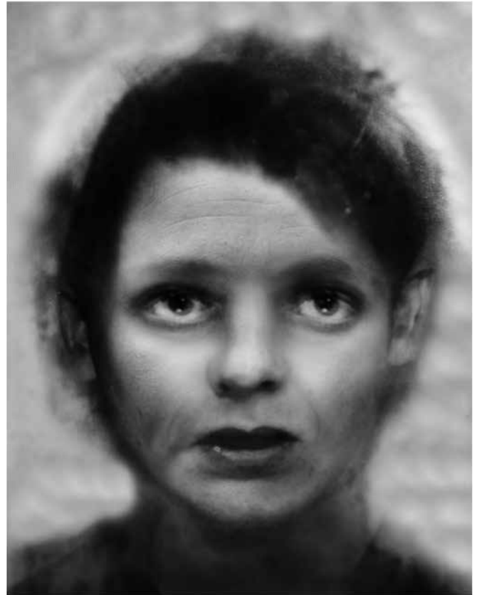
© Eva Beazar, A constructed family , 2016