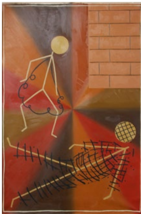
© Leen Voet, M & A #4 , 2014